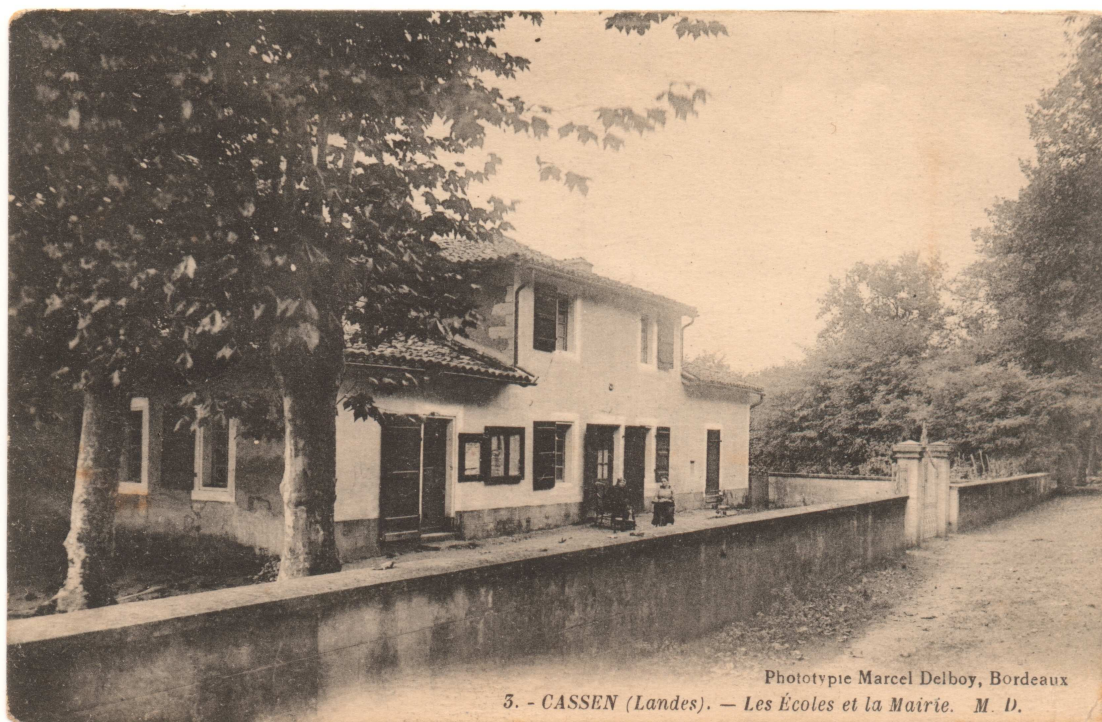
La maison commune, vers 1925

Ce n'est qu'en 1835 que le maire François Geoffroy orchestre la construction de la maison commune, qui comprend sur deux étages, la mairie, l'école, le logement de l'instituteur et l'appartement du porcher communal.